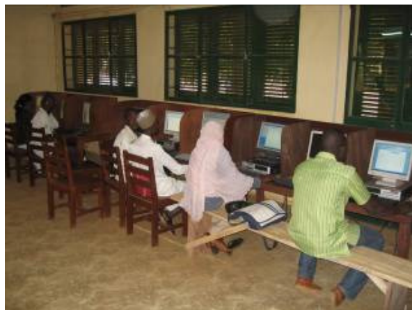
Salle informatique du Lycée KOROMBE