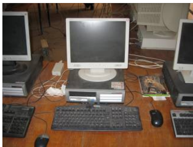
Ordinateur fourni par EPAD/AREVA