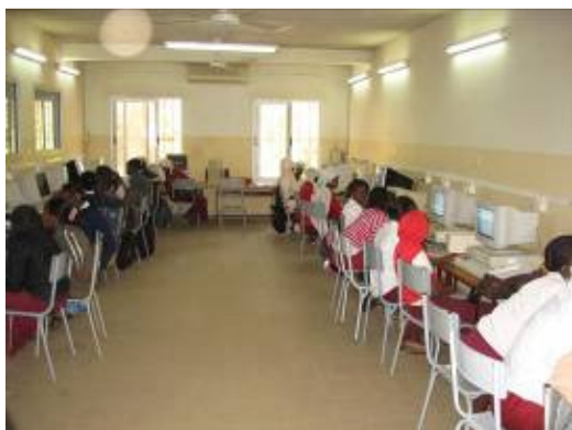
Salle informatique du collège MARIAMA

La salle informatique ne dispose pas de connexion Internet. Elle comprend 20 ordinateurs fournis initialement par la Mission Catholique. L'établissement finance le renouvellement et la maintenance sur fonds propres ; 26 heures de formation sont possibles chaque semaine : les classes de 5 ème , 4 ème et 1 ère ont 1 heure par semaine par ½ promotion, ce qui permet à chaque étudiant réalisant un cycle dans l'établissement d'avoir quelques notions d'informatique. Les cours d'informatique sont gratuits, les études étant payantes.