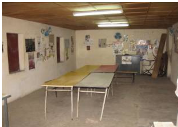
Salle disponible au CEG1

Nous nous sommes rendus ensuite au Lycée.