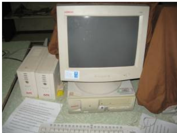
Ordinateur fourni par le PNUD