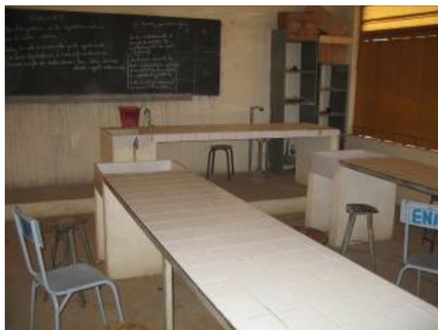
Laboratoire disponible pour la salle Multimédia