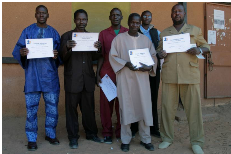
CES BIRNI : Remise des attestations de présence à la formation