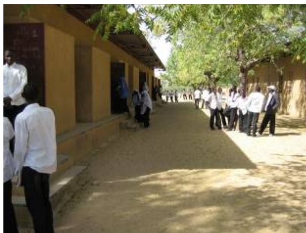
Vue du lycée