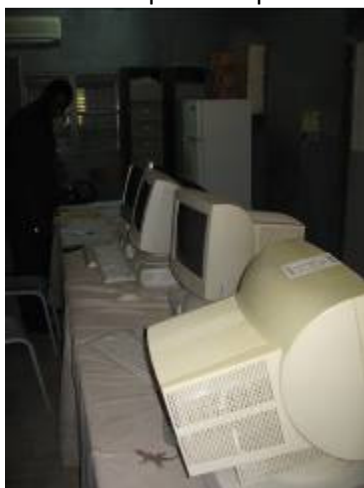
Salle des professeurs

Une salle de laboratoire non utilisée serait disponible pour recevoir une salle informatique. Monsieur Noufou Baba Touré, responsable du comité pédagogique, nous a remis un document détaillant le projet de création d'une salle multimédia que nous pourrions soutenir.